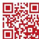
携帯用ミストスプレー 50mL (シール2種入) 275円 (税込)

パーソナビューティ・アカデミーは一人でも多くの女性を健康で美しい肌へ導くための「学び」と「体験」の場です