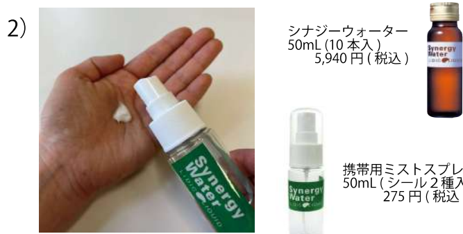
シナジーウォーター 50mL (10本入) 5,940円 (税込)