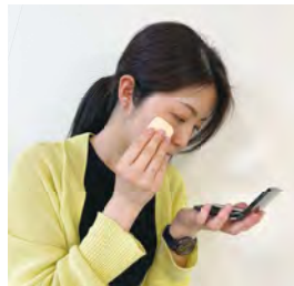
パウダーファンデーションを付ける

セルウォーターをサンドイッチで一緒に使うことで、とても気持ちいい仕上がりになります。何度付けても付けた感じがしない爽やかな仕上がりでお肌を紫外線から守ります。