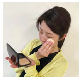
パウダーファンデーションを付ける