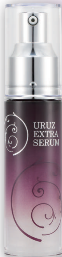
ウルズ エクストラセラム 30mL

— 水面に落ちた水滴のように、肌に溶け込み消える感動。それは独自成分サイモス60による体内水分と親和する働き—